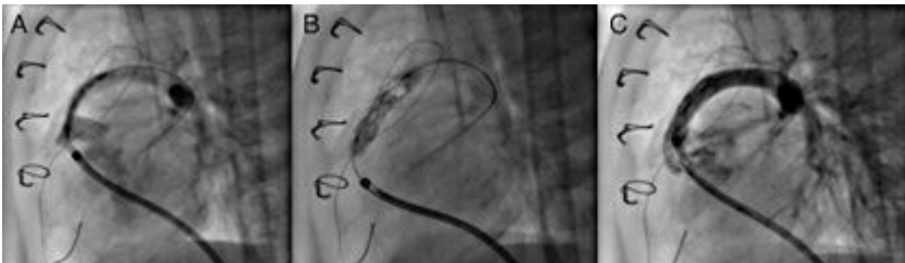
Figura 3. Imágenes durante el procedimiento mostrando el posicionamiento del stent Palmaz Blue® de 6 x 18 mm en el extremo proximal del conducto de Sano A), el despliegue del stent durante la insuflación del catéter balón (B) y el resultado angiográfico final favorable (C).