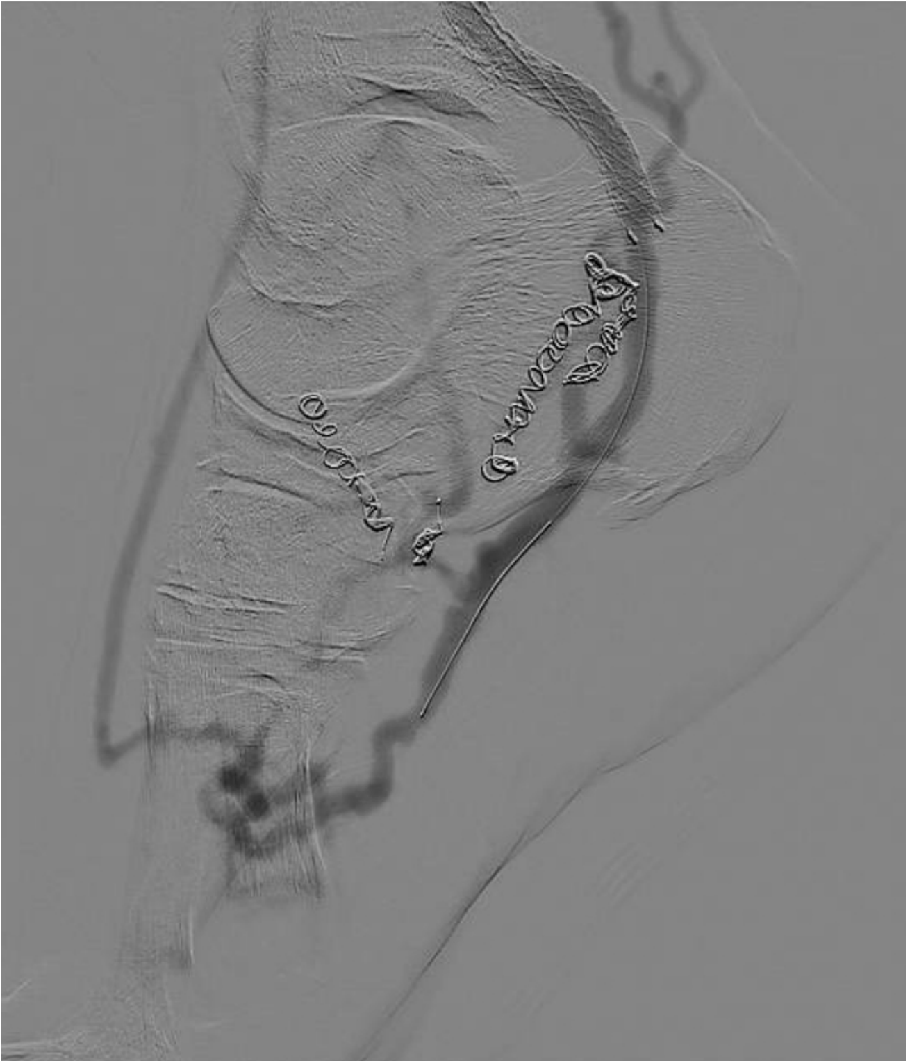
Figura 2: Angiograma final post-arterialización endovascular.

Miranda, Jorge M.D. 1 , Elizondo-Adamchik, Héctor M.D., Montero-Baker, Miguel M.D. 2